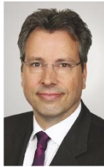
Andre Prahl Mediengruppe RTL Deutschland